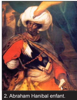
2. Abraham Hanibal enfant.

Grand voulait démontrer que ces enfants à peau noire pouvaient être éduqués aussi bien que ceux à peau blanche. Le choix se porta sur les deux petits Kotoko : ils étaient les plus jeunes et en plus très beaux. Et départ vers la Russie : il faudra dix semaines à travers la Bulgarie, la Moldavie, l'Ukraine, pour atteindre Moscou. On dut attendre le tsar parti guerroyer contre la Suède. D'emblée, il est séduit par le jeune Ibrahim et le prend à son service personnel, le fait habiller, lui fait apprendre le russe et ... la religion orthodoxe. Le 13 juillet 1705, Brouha-Ibrahim est baptisé à Vilnius. Il devient Abraham Pétrovitch, filleul et fils adoptif du Tsar, la reine de Pologne étant sa marraine.