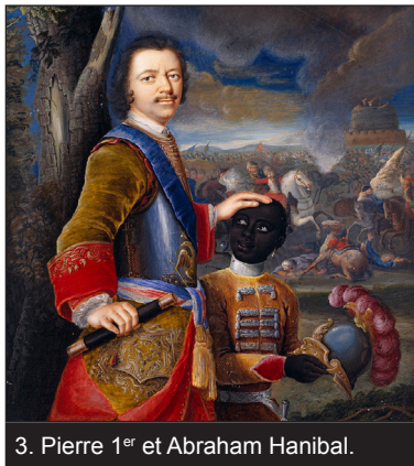
3. Pierre 1 er et Abraham Hanibal.

Les années passent, Abraham suit le Tsar partout (Fig. 2-3). À 12 ans, il devient tambour au régiment Préobrajanski, le plus prestigieux de l'armée russe. Il y connaît son baptême du feu, toujours contre la Suède. Entre les épisodes guerriers, il partage la vie de la famille impériale, côtoie les jeunes nobles de la cour, parfait son éducation. L'instruction du peuple russe quasiment illettré à tous les échelons de la société sera l'un des soucis permanents du tsar. Abraham, particulièrement doué pour les mathématiques, servira d'exemple.