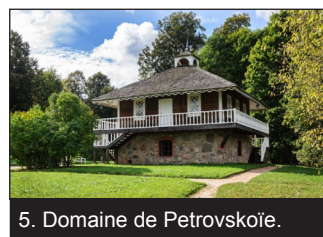
5. Domaine de Petrovskoïe.

Abraham Hanibal fait fructifier son domaine, en achète d'autres tout en étant gouverneur de Reval en Lituanie, sert les impératrices, Elisabeth qui lui offre le domaine de Petrovskoïe (Fig. 5) et le nomme général en chef, puis Catherine II. Il participe à l'assèchement des marais autour de Saint-Petersbourg, aux fortifications de Kiev 6 . À sa mort en 1781, il possédait plusieurs immenses domaines auxquels étaient attachés environ un millier de serfs. Lui qui, jadis, avait été enlevé pour devenir esclave se trouvait propriétaire d'esclaves. Il était un homme de son temps... 7